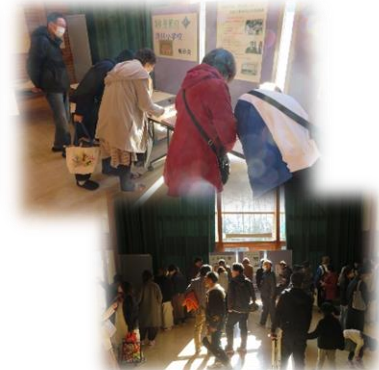
『50年前の清川小学校提示会』