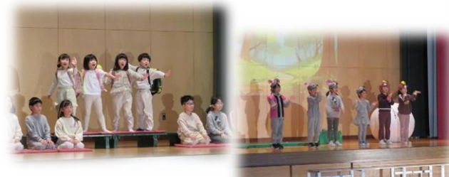
低・『はじめのことば』『なんだろう?』

10月29日の全校朝会冒頭で子どもたちには、『みなさん一人一人が自分の役割にチャレンジし、仲間と力を合わせずてきな発表をしてくれることやみなさんが主役として輝く姿を期待しています。』という話をしました。日常の学習の様子や特別時間割に入ってから取り組む子どもたちの姿からは、自分の役割にチャレンジする姿、仲間と相談したり、お互いにアドバイスし合ったりと力を合わせ取り組む姿がたくさん見られました。当日も、今年度の学校経営の重点である、『一人一人が主役として輝く学校』を体現してくれたものと確信しております。当日に向け、各家庭の保護者の皆様の支えや各学級の担任や指導に携わった教職員の力のおかげで、すてきな学習発表会になったと思います。各ブロックの発表も良かったですし、5年振りの全校合唱も良かったですね。感動の歌声でした。この日の輝く清川っ子の姿を見て、とても嬉しい気持ちになりました。私も、中学年ブロックの大縄跳びの縄回し役として出番を与えてもらい、感謝です！また、特別企画!?'50年前の清川小学校提示会'も多くの方に見ていただき嬉しい限りです。ありがとうございました。機会があれば、今年度の学習発表会、皆様のご感想を聞かせていただけると幸いです。