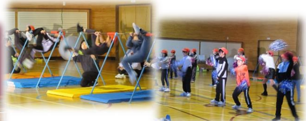
中・『24時間テレビ「愛は地球を救う」』