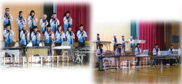
高・『ふるさと清川～日本の祭り～』